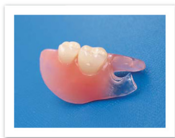
[ノンクラスプデンチャー・二色成形義歯]