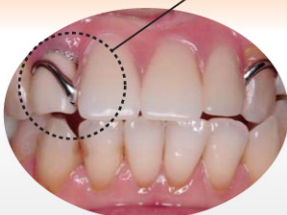
入れ歯を支えるための 金属バネを使用した入れ歯